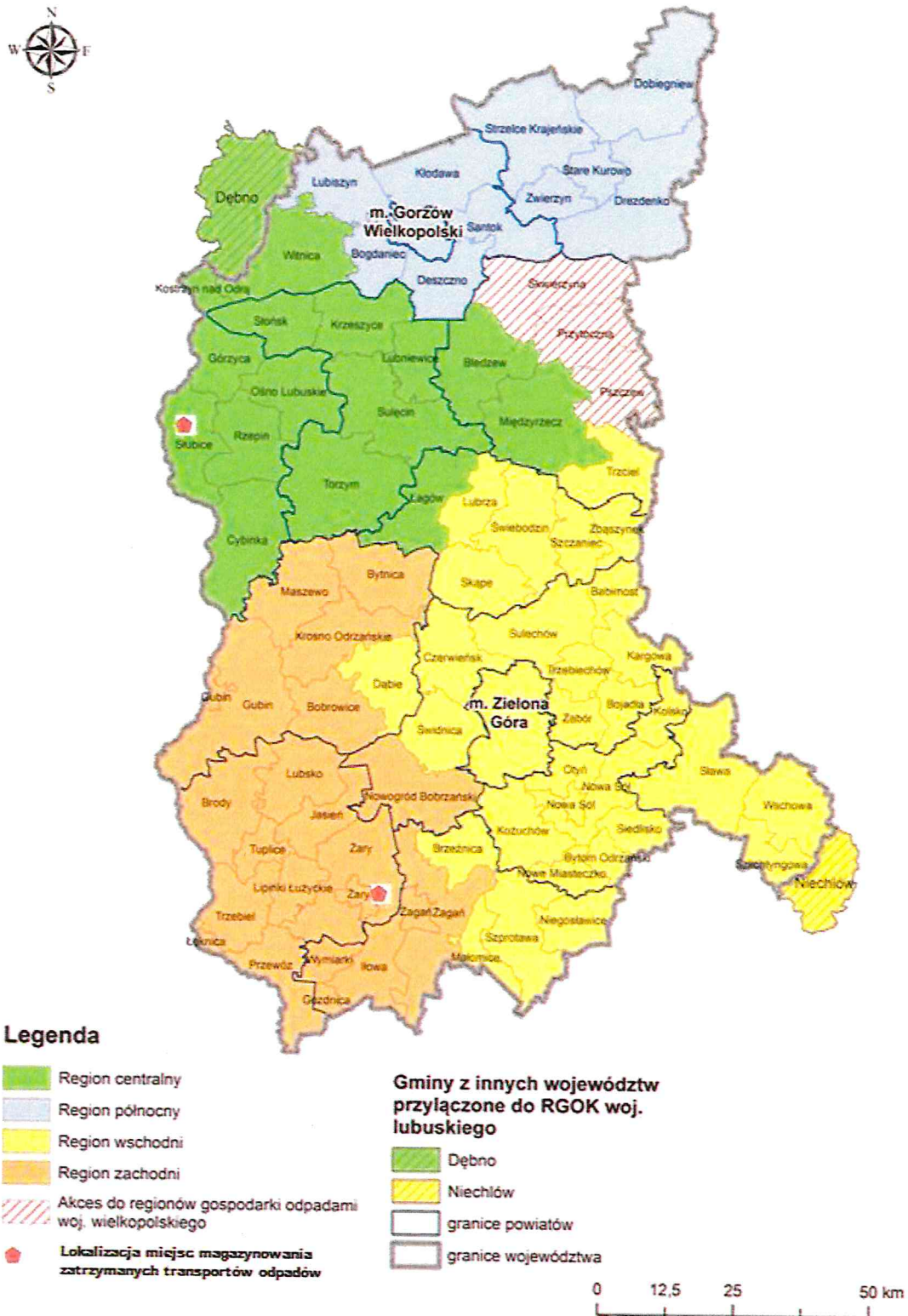
Rysunek .1. Rozmieszczenie miejsc magazynowania zatrzymanych transportów odpadów w województwie lubuskim