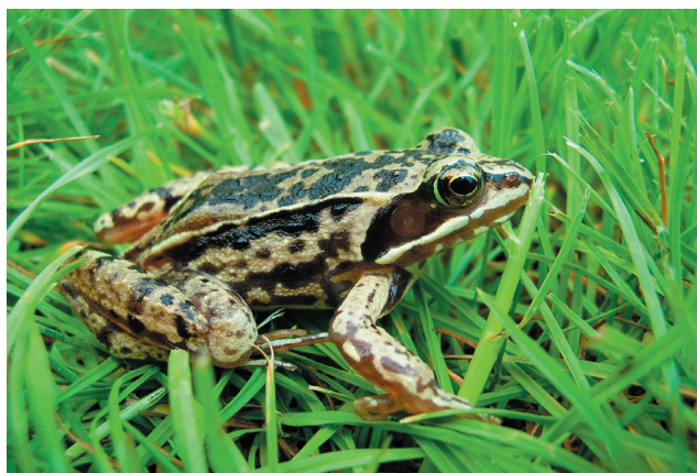
Żaba trawna - przedstawiciel żab brunatnych

13. Żaba trawna Rana temporaria - w typowych dla siebie siedliskach jest najpospolitszym gatunkiem spośród żab brunatnych na opisywanym obszarze.