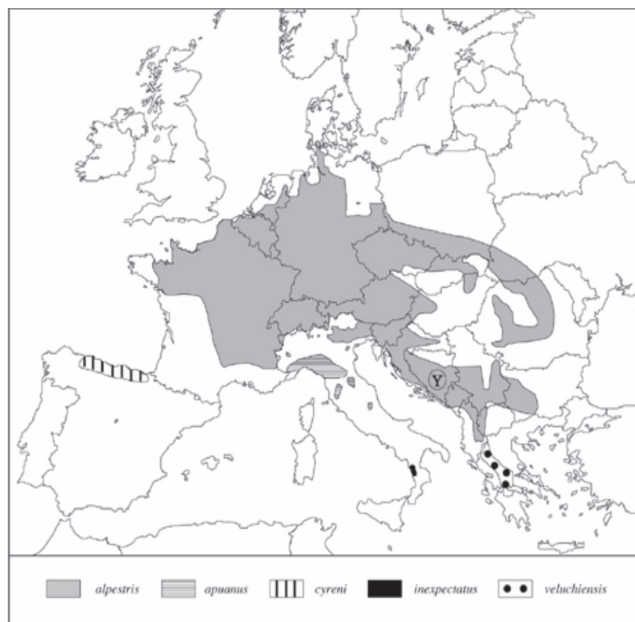
Ryc. 1. Rozmieszczenie traszki górskiej w Europie

Na terenie Europy zachodniej traszka górska występuje znacznie dalej na północ niż w Polsce. Najdalej wysunięte stanowiska znajdują się w Danii (ryc. 1).