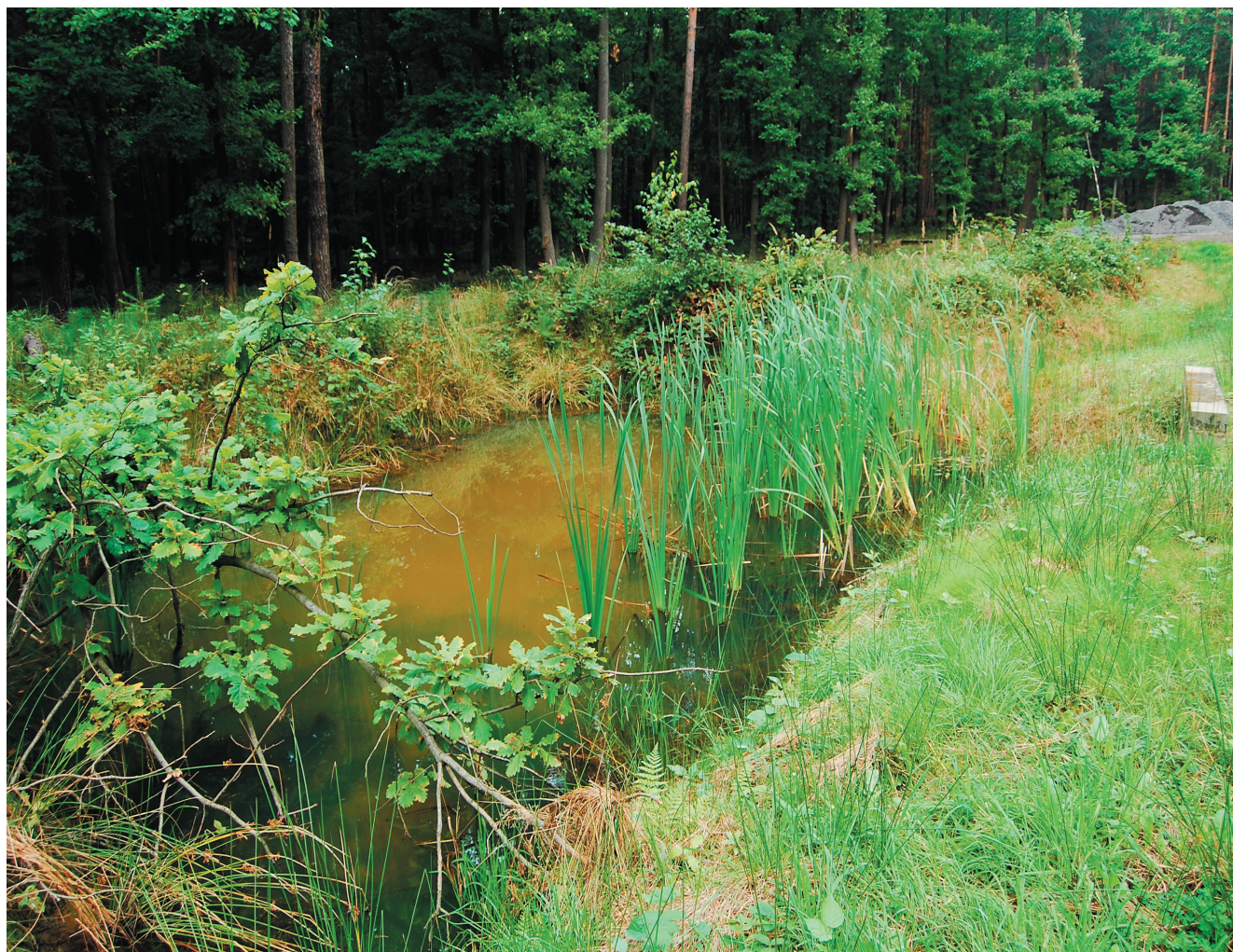
Zbiorniki odbierające wodę z dróg śródleśnych są obecnie miejscem najliczniejszego występowania traszki górskiej w okolicach Koźuchowa