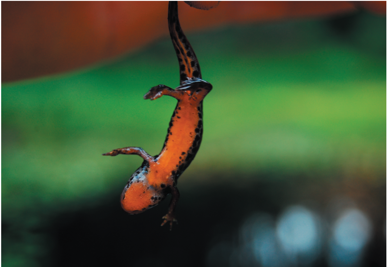
Charakterystyczną cechą traszki górskiej jest pomarańczowy brzuch bez plam