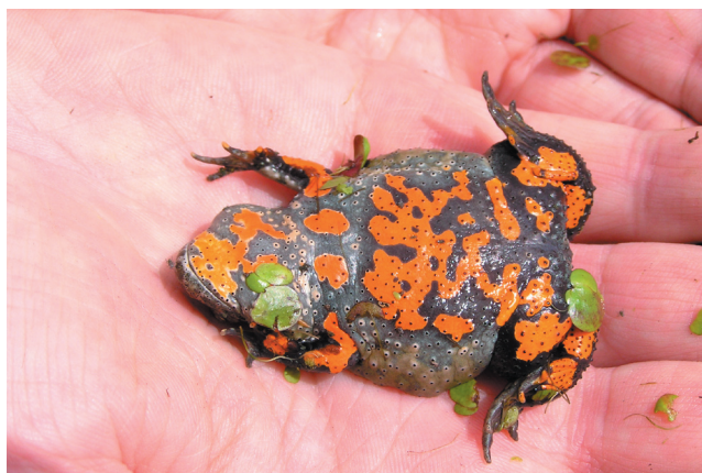
Kumak nizinny posiada na spodniej stronie ciała charakterystyczne ubarwienie

narkowy, szczególnie na głowie i w przedniej części tułowia. Preferuje raczej zbiorniki z wodami stojącymi z bogatą roślinnością przybrzeżną: niewielkie oczka śródlądowe, jeziora, kanały.