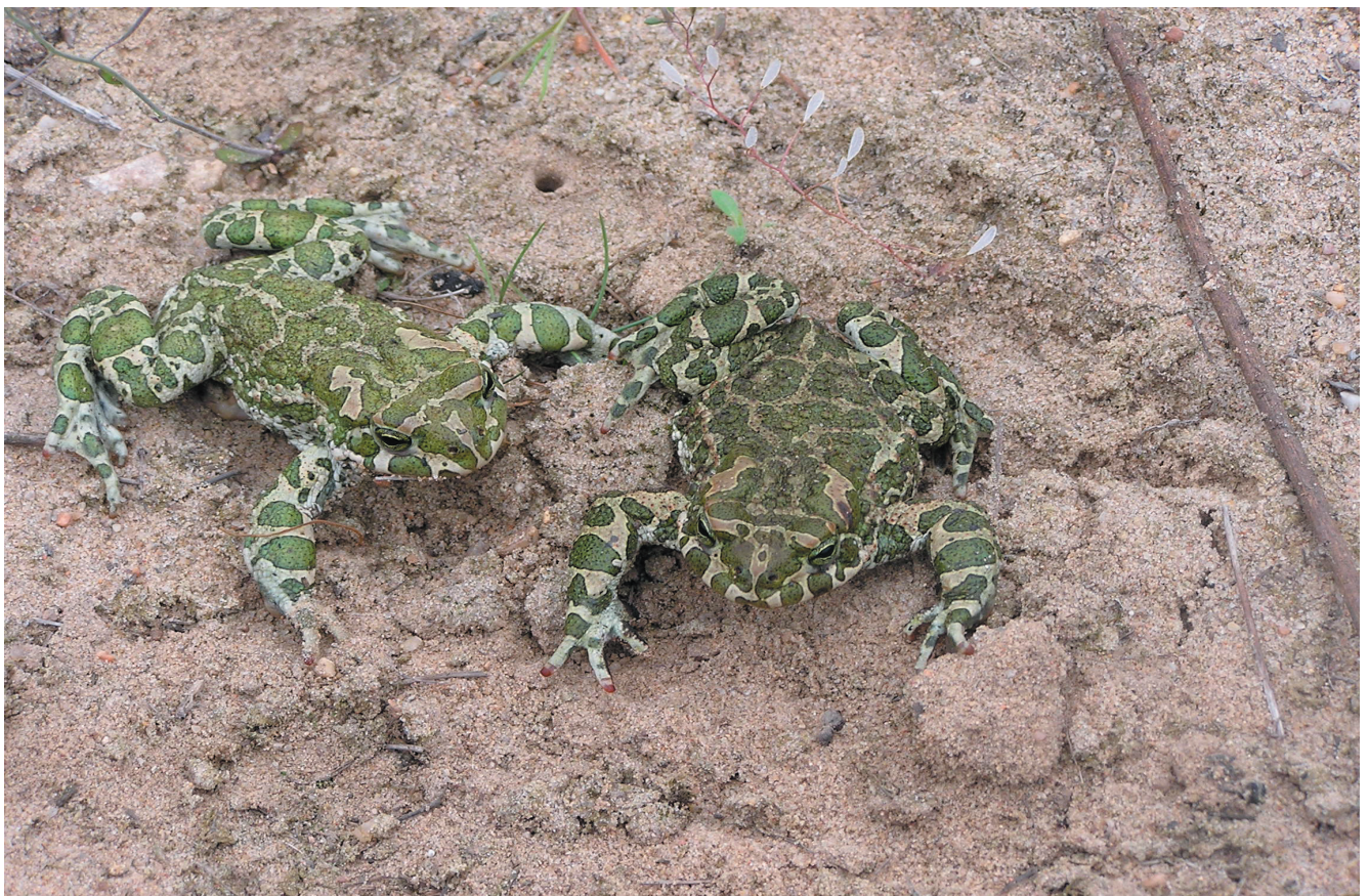
Ropucha zielona