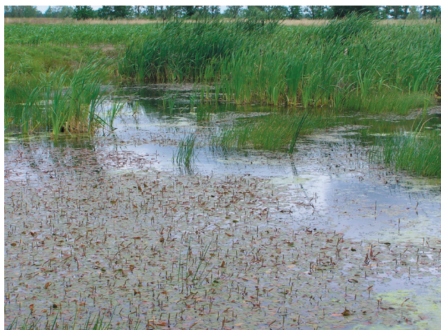
Niewielkie zbiorniki śródpolne stanowią kluczowe miejsce rozrodu dla wielu gatunków płazów

Pomimo wieloletniej ochrony prawnej, szczególnie w ostatnich latach, obserwuje się stopniowe znikanie populacji zarówno tych najrzadszych gatunków płazów jak i gatunków dotychczas uznawanych za pospolite. Dzieje się tak zarówno na całym terytorium Polski jak i w krajach Europy Zachodniej. Są też głosy mówiące o globalnej skali tego zjawiska szczególnie w ostatnich dziesięcioleciach (Beebee 1996).