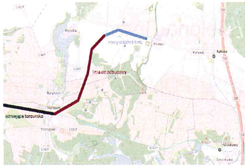
mru1.png 229 KB