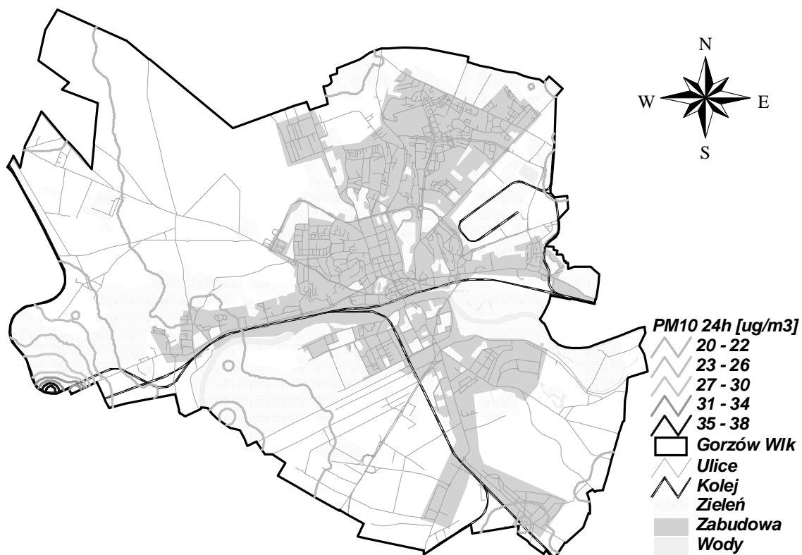
Rysunek 15 Całkowita emisja napływowa PM10 24h w Gorzowie Wielkopolskim w 2005 r.