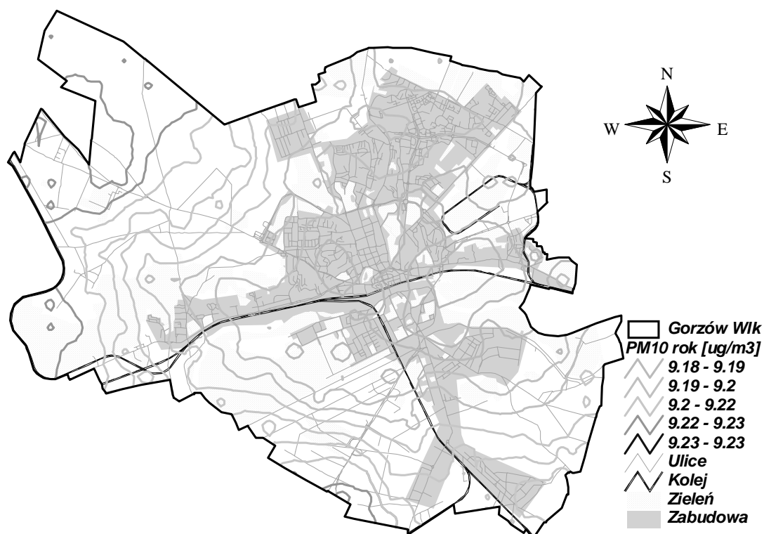
Rysunek 12 Stężenia PM10 rok w Gorzowie Wielkopolskim pochodzące od źródeł zlokalizowanych poza województwem lubuskim w 2005 r.