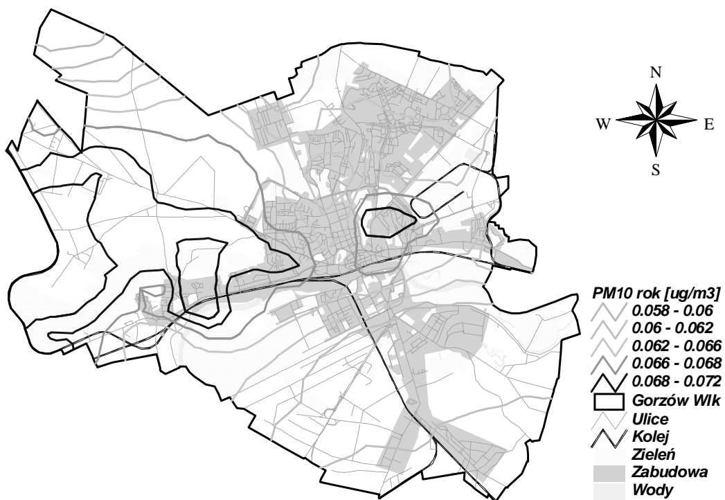
Rysunek 4 Stężenia PM10 rok w Gorzowie Wielkopolskim pochodzące od emitorów punktowych o wysokości komina powyżej 30 m z terenu województwa lubuskiego w 2005 r.