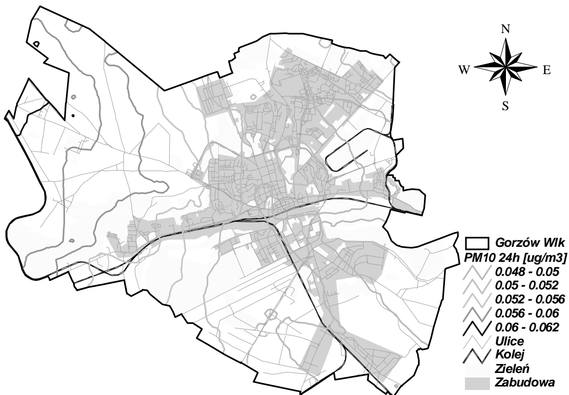
Rysunek 13 Stężenia PM10 24h w Gorzowie Wielkopolskim pochodzące od źródeł punktowych z terenu Niemiec w 2005 r.