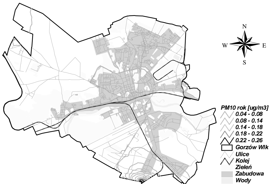
Rysunek 6 Stężenia PM10 rok w Gorzowie Wielkopolskim pochodzące od emitorów punktowych zlokalizowanych w pasie 30km od miasta w 2005r.