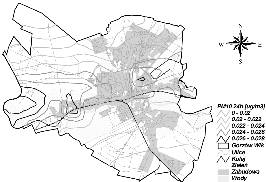
Rysunek 3 Stężenia PM10 24h w Gorzowie Wielkopolskim pochodzące od emitorów punktowych o wysokości komina powyżej 30 m z terenu województwa lubuskiego w 2005 r.