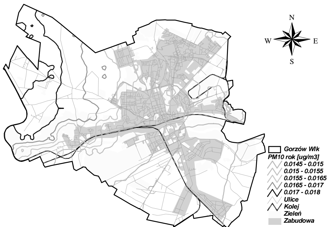
Rysunek 14 Stężenia PM10 rok w Gorzowie Wielkopolskim pochodzące od źródeł punktowych z terenu Niemiec w 2005 r.