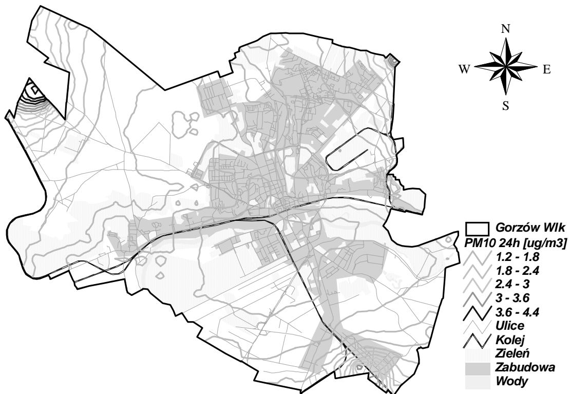
Rysunek 9 Stężenia PM10 24h w Gorzowie Wielkopolskim pochodzące od źródeł komunikacyjnych zlokalizowanych w pasie 30 km od miasta w 2005 r.