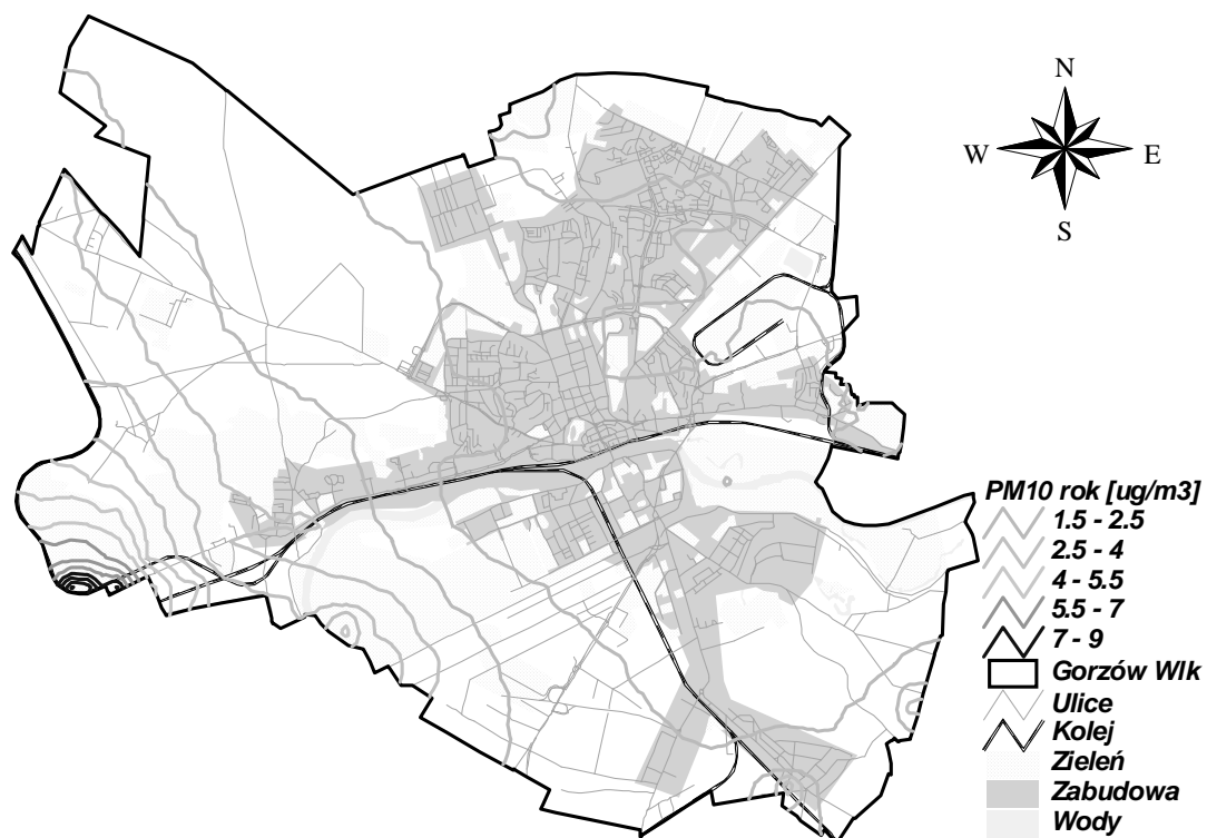
Rysunek 8 Stężenia PM10 rok w Gorzowie Wielkopolskim pochodzące od źródeł powierzchniowych zlokalizowanych w pasie 30 km od miasta w 2005 r.