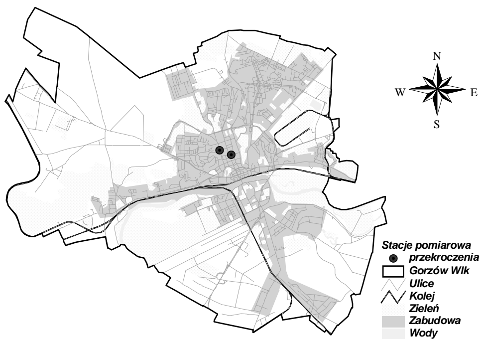
Rysunek 1 Przekroczenia wartości dopuszczalnej PM10 24h 36 max na stacjach wyznaczonych przez WIOŚ do oceny rocznej w Gorzowie Wielkopolskim w 2005 r.