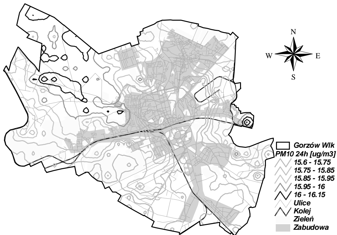
Rysunek 11 Stężenia PM10 24h w Gorzowie Wielkopolskim pochodzące od źródeł zlokalizowanych poza województwem lubuskim w 2005 r.