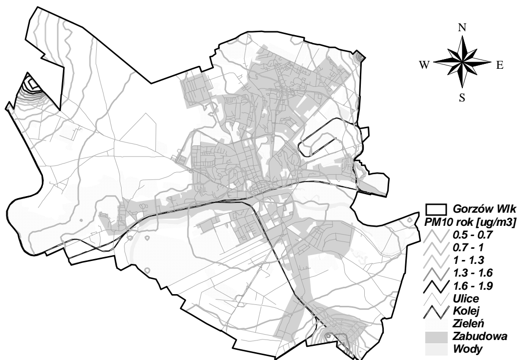
Rysunek 10 Stężenia PM10 rok w Gorzowie Wielkopolskim pochodzące od źródeł komunikacyjnych zlokalizowanych w pasie 30 km od miasta w 2005 r.