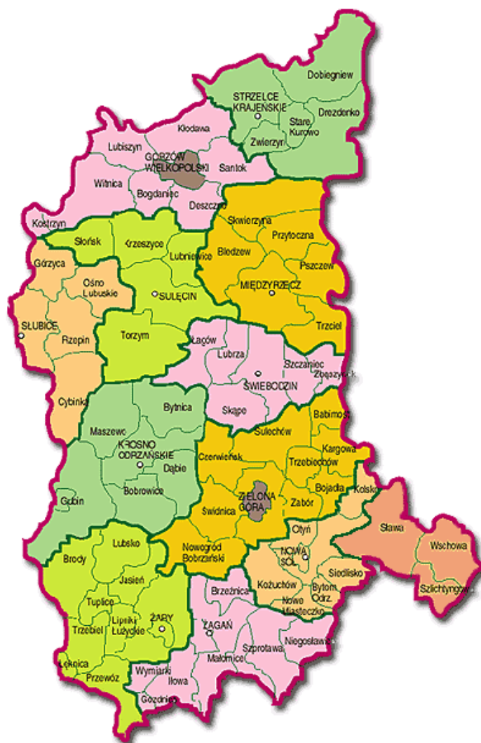
Rysunek 1. Podział administracyjny województwa lubuskiego