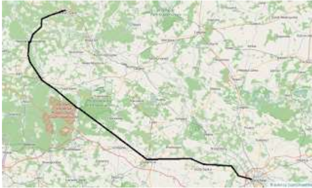
Fot. plany budowy łącznicy w Bieniowie i postulowanego- w 85 proc. dwutorowego połączenia Ziel. Góra- Małomice- Legnica- Wrocław, cc openstreetmap

Województwo lubuskie posiada bardzo mało rozwiniętą sieć kolejową. Nie istnieją funkcjonalne, szybkie połączenia kolejowe w kierunku południowym.