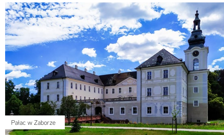
Pałac w Zaborze