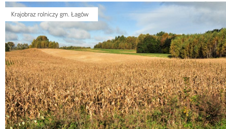
Krajobraz rolniczy gm. Łagów