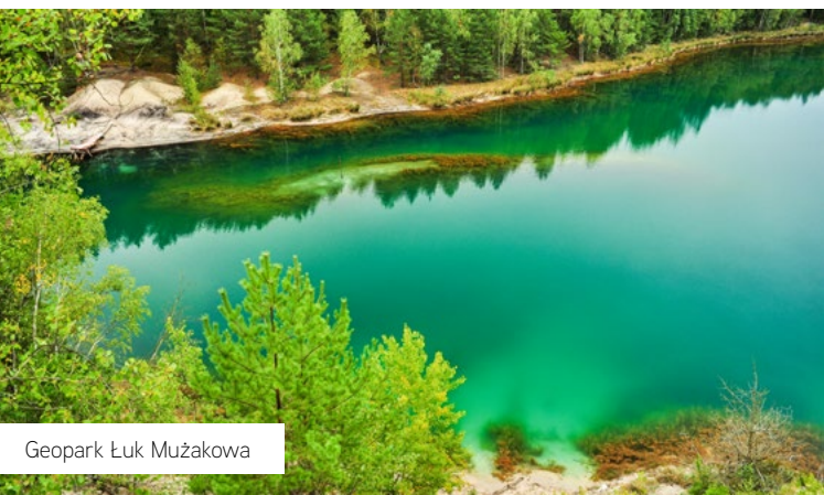
Geopark Łuk Mużakowa

W Polsce, skutkiem procesu wdrażania zapisów ww. Konwencji jest uchwalenie ustawy z dnia 24 kwietnia 2015r. o zmianie niektórych ustaw w związku ze wzmocnieniem narzędzi ochrony krajobrazu (Dz. U z 2015 r., poz.774 z późn. zm.). Znowelizowany art. 38 ustawy o planowaniu i zagospodarowaniu przestrzennym nakłada obowiązek sporządzenia przez samorząd województwa nowego opracowania planistycznego jakim jest audyt krajobrazowy .