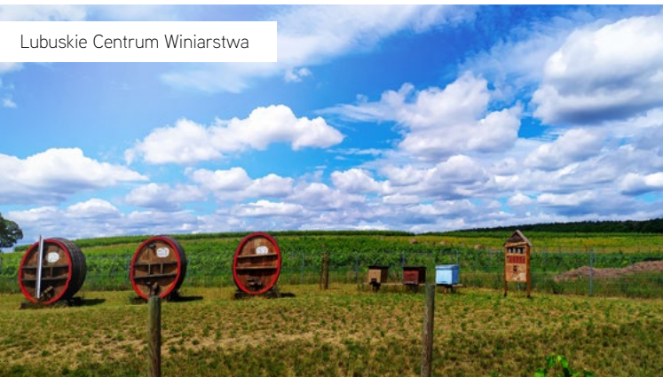
Lubuskie Centrum Winiarstwa