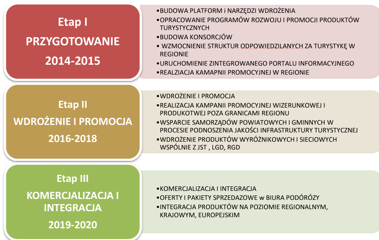
Schemat 3 Podział procesu realizacji Programu Rozwoju Lubuskiej Turystyki na etapy

Zakłada się realizację celów i działań zapisanych w strategii w ramach 3 etapowego procesu wdrażania. Każdy z etapów będzie nieco inaczej ogniskował wysiłek w procesie rozwoju funkcji turystycznej regionu. W pierwszym etapie, obejmującym lata 2014-2015, będzie miało miejsce przygotowanie wszelkich niezbędnych narzędzi i warunków do rozpoczęcia systematycznego i ciągłego wysiłku służącego rozwojowi funkcji turystycznej regionu. W drugim etapie, w latach 2016-2018, zostanie zrealizowanych większość działań wdrożeniowych i promocyjnych mających na celu dopracowanie oferty turystycznej regionu i jej odpowiednie ukazanie odbiorcom. W trzecim etapie, planowanym na lata 2019-2020, podstawowym wysiłkiem będzie prowadzenie działań służących skutecznej komercjalizacji oferty turystycznej regionu w skali kraju i zagranicy. W okresie tym będzie miała miejsce również daleko idąca integracja oferty regionu na poziomie krajowym i europejskim.