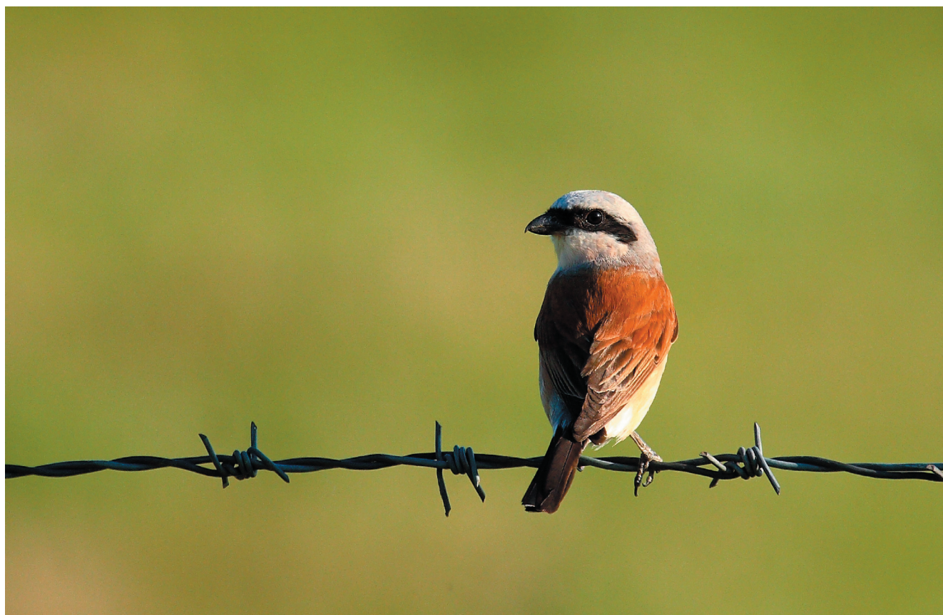
Gąsiorek Lanius collurio - gatunek związany głównie z krajobrazem rolniczym, występujący jeszcze dość powszechnie

Obszar obejmuje cały fragment doliny Odry w województwie lubuskim. Jest to środkowy bieg rzeki, płynącej najpierw w kierunku południe-północ, następnie w kierunku zachodnim i od ujścia Nysy Łużyckiej ponownie w kierunku północnym. W dolinie Odry stwierdzono 25 gatunków ptaków lęgowych i kolejne 29 gatunków przelotnych i zalatujących wymienionych w załączniku I „Dyrektywy Ptasiej”. Do najcenniejszych gatunków lęgowych należą: bocian czarny (5 par), kania czarna (około 26 par), kania ruda (30-35 par), bielik (2-4 pary), błotniak łąkowy (2-3 pary), derkacz (około 100 samców), dzięcioł średni (około 320 par), jarzębatka (około 60 par) i muchołówka mała (około 6 par). Na szczególną uwagę zasługują: kania czarna, k. ruda i dzięcioł średni, dla których dolina Odry jest jedną z najważniejszych ostoi w Polsce. Z gatunków przelotnych i zalatujących regularnie obserwuje się: czaple białą, łabędzia czarnodziobego Cygnus columbianus , łabędzia krzykliwego, berniklę białolicą Branta leucopsis , rybołowa, drzemlika Falco