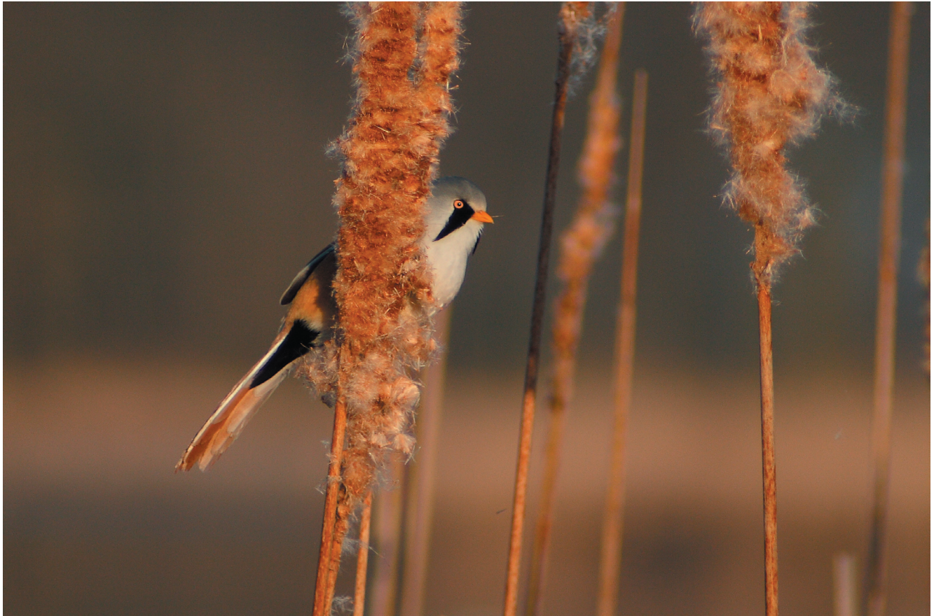
Wąsatka Panurus biarmicus

tach 1990. w zależności od roku (warunków wodnych) gniazdowało do 200 par (Tomiałojć, Stawarczyk 2003). Poza tym kilka-kilkanaście par w sprzyjających warunkach gniazduje w pozostałej części doliny Warty. Jeszcze mniej liczny jest w dolinie Odry, gdzie prawdopodobnie lęgowe pojedyncze pary stwierdzono w kilku miejscach, m.in. w okolicach ujścia Ołoboku, Krosna Odrz. i Słubic.