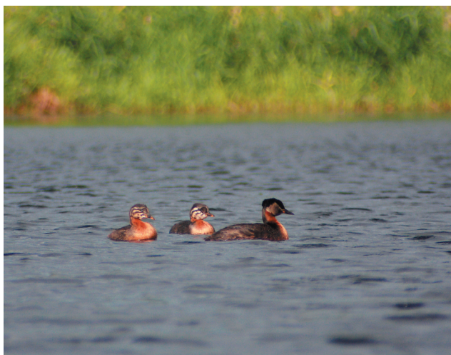
Perkoz rdzawoszyi Podiceps grisegena (dorosły ptak z młodymi) - gatunek zmniejszający liczebność w ostatnich latach (dolina Warty)

Sieweczka obroźna gniazduje nieregularnie. W latach 1980. lęgową parę stwierdzono na stawach koło Czetowic, ponadto do 2 par w rez. Słońsk (Jermaczek i in. 1995). Poza sezonem lęgowym niezbyt często obserwowana w dolinie Odry (Bocheński i in. 2006c), na zbiornikach koło Krosna Odrz. i stawach rybnych.