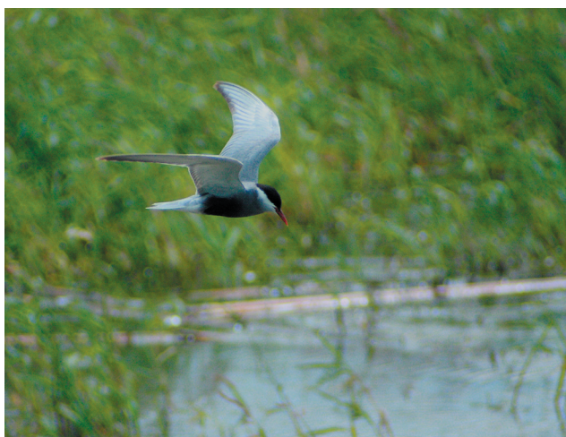
Rybitwa białowąsa Chlidonias hybrida - gatunek zwiększający liczebność w kraju, w lubuskim gniazduje na rozlewiskach Warty i Odry