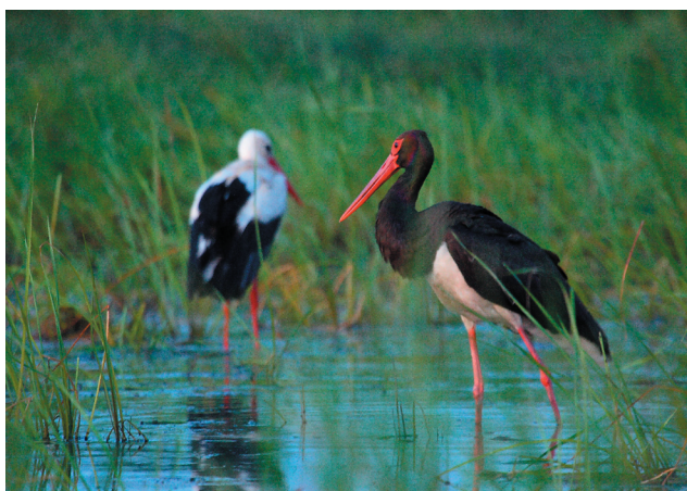
Bocian czarny Ciconia nigra - rozlewiska w dolinie Odry są miejscem żerowania tych ptaków, często wspólnie z bociąnem białym Ciconia ciconia (dolina Odry)